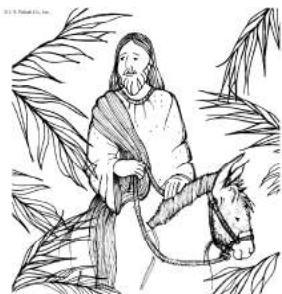
Blessed is he who comes in the name of the Lord.

Today, March 25, we recall Our Lord's entry into Jerusalem and the start of Holy Week. On Palm Sunday we will distribute palms as we enter the church and we will bless the palms at the beginning of each Mass. Please note: 12:30 Mass will be moved to 1PM on March 25th.