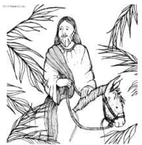
Blessed is he who comes in the name of the Lord.

Dzisiaj, Niedzielą Palmową rozpoczynamy Wielki Tydzień. Palmy będą rozdawane przy wejściu do kościoła i święcone na początku każdej Mszy św.