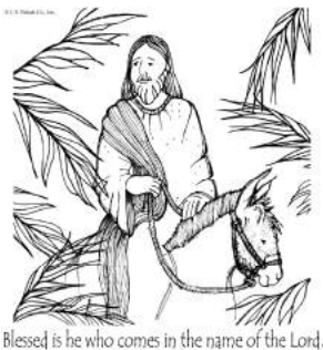
Blessed is he who comes in the name of the Lord.

Poświęcenia palm przed Mszą św. o godzinie 11:00 dokonamy na placu przy szkole, po czym uroczyste z procesją udamy się do naszego kościoła.