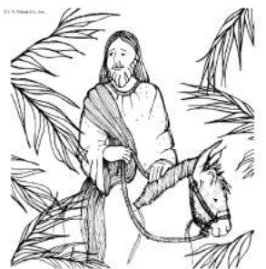
Blessed is he who comes in the name of the Lord.

Today, April 9, we recall Our Lord's entry into Jerusalem and the start of Holy Week. On Palm Sunday we will distribute palms as we enter the church and we will bless the palms at the beginning of each Mass. Please note: 12:30 Mass will be moved to 1PM on that day.